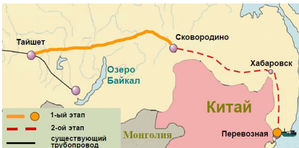
Маршрут строительства нефтепровода «Восточная Сибирь – Тихий Океан»