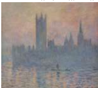
Клод Моне. Вестминстерский дворец зимой