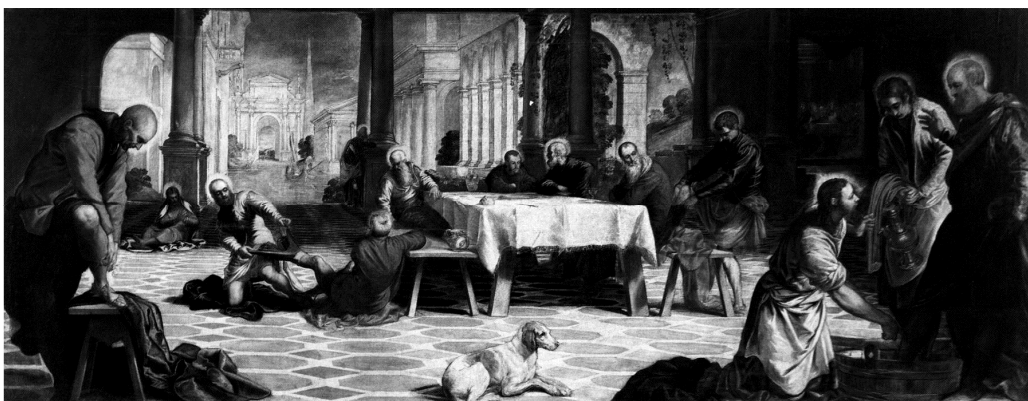
Якопо Тинторетто «Омовение ног» (Венеция, сер. XVI века)