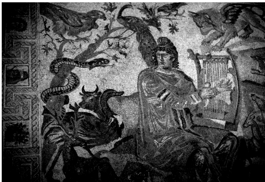
Орфей, мозаика из города Филиппополиса, Сирия, 4 век

Б) Посмотрите на мозаику из античного города Филиппополиса, на которой изображён античный герой Орфей. Этот образ, особенно популярный в эпоху поздней античности и раннего христианства, был во многом близок образу Христа, который сложился в первые века нашей эры. Найдите среди первых четырёх изображений то, которое, на Ваш взгляд, наиболее близко образу Орфея. Кратко опишите символическое и стилистическое сходство и разницу между образом Орфея и выбранным Вами образом Христа.