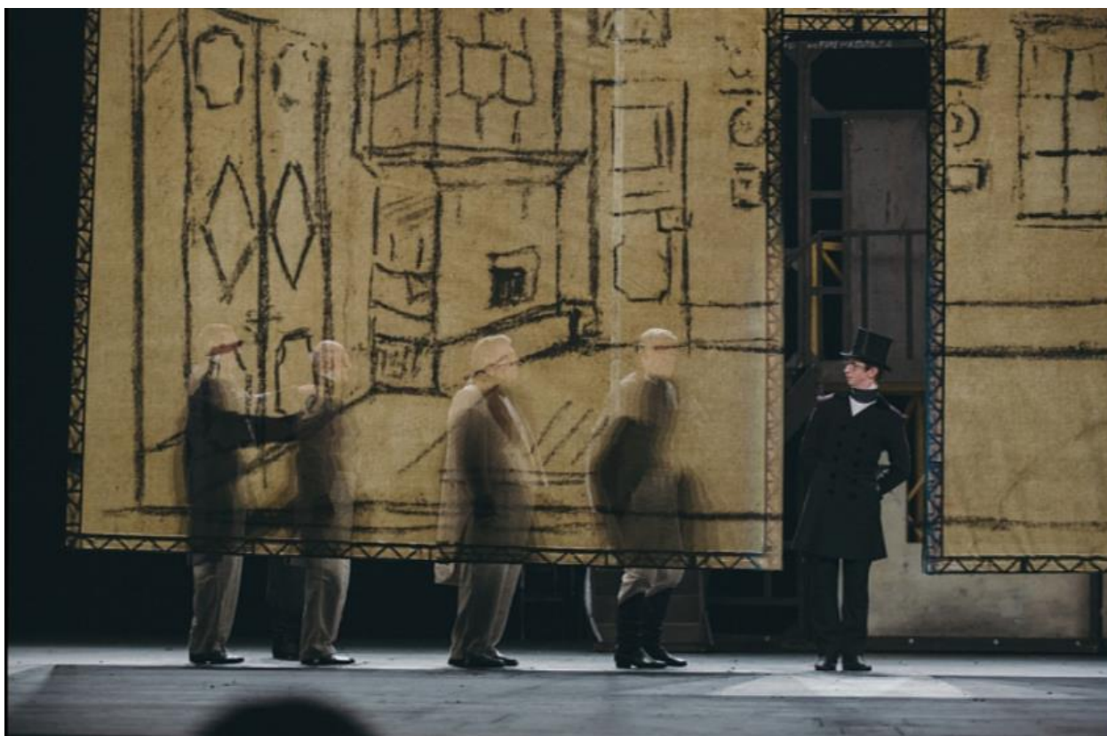
Художественное оформление спектакля – Александра Боровского.