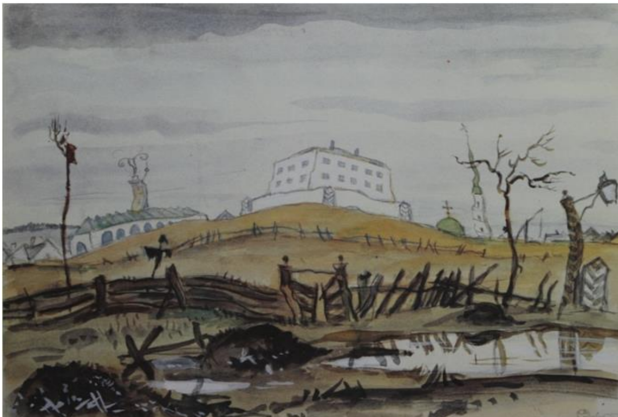
Эскиз занавеса. Художник – Мстислав Добужинский.