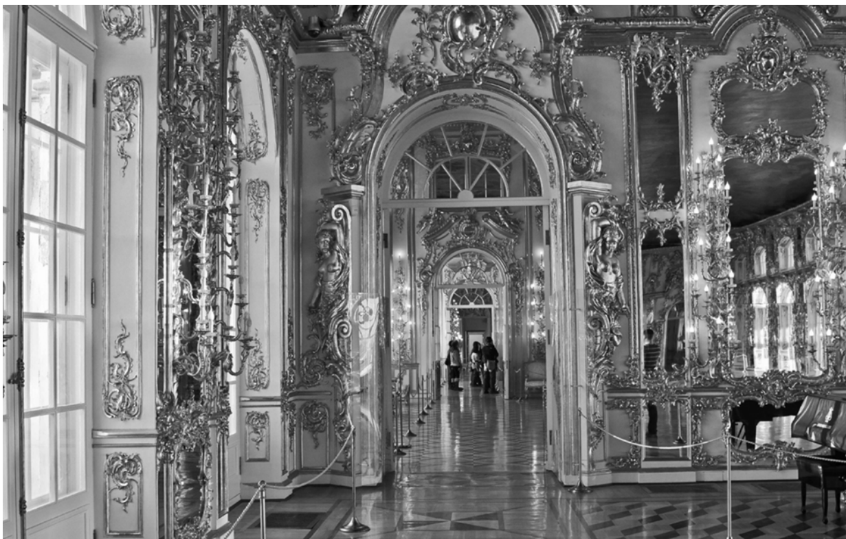
Зеркальный зал в усадьбе Кусково