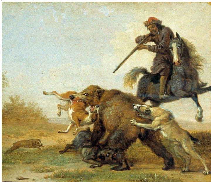
Пауль (Паулюс) Поттер (1625 – 1654) «Медвежья облава» («Наказание охотника»)