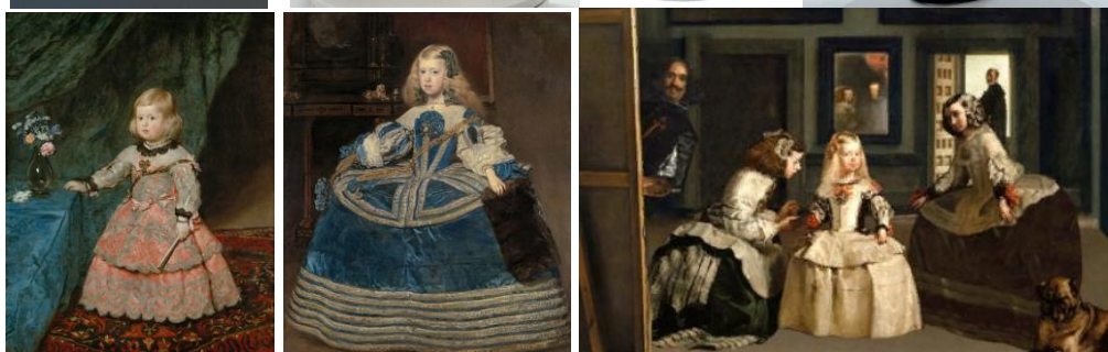
Инфанта Маргарита Тереза в розовом платье. Инфанта Маргарита Тереза в голубом платье.