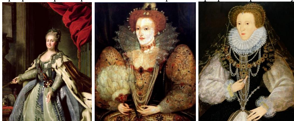
Королева Елизавета I. Мастера английской школы