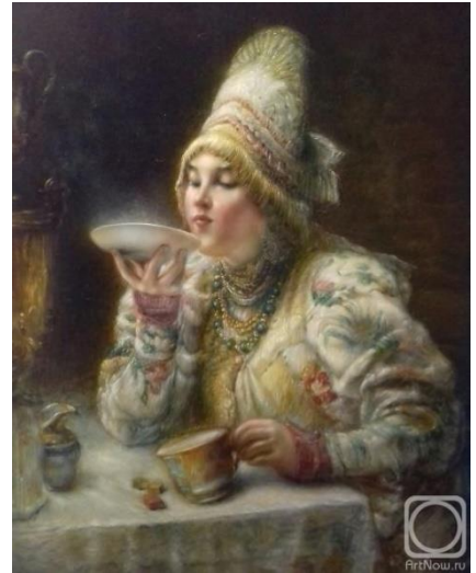
К. Маковский. «За чаем».