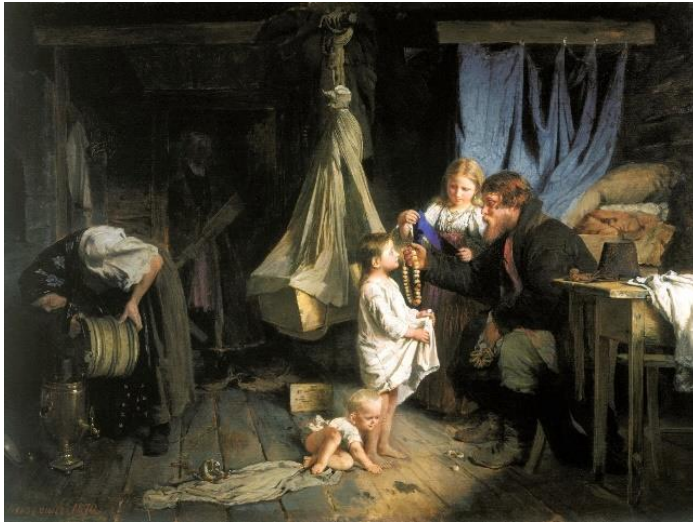
А.И. Корзухин. «Возвращение из города».