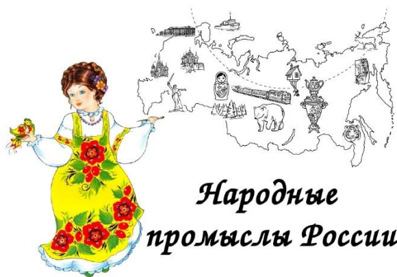
Народные промыслы России