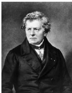
Георг Симон Ом

Единица электрического сопротивления названа в честь немецкого физика Георга Симона Ома.