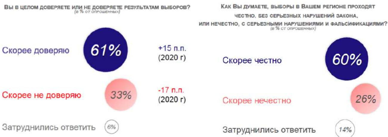
Рисунок 2. Распределение ответов на вопросы о доверии и честности выборов (в % от опрошенных)

15.1. Какой тип социального поведения исследовался социологами? Укажите его социологическое название.