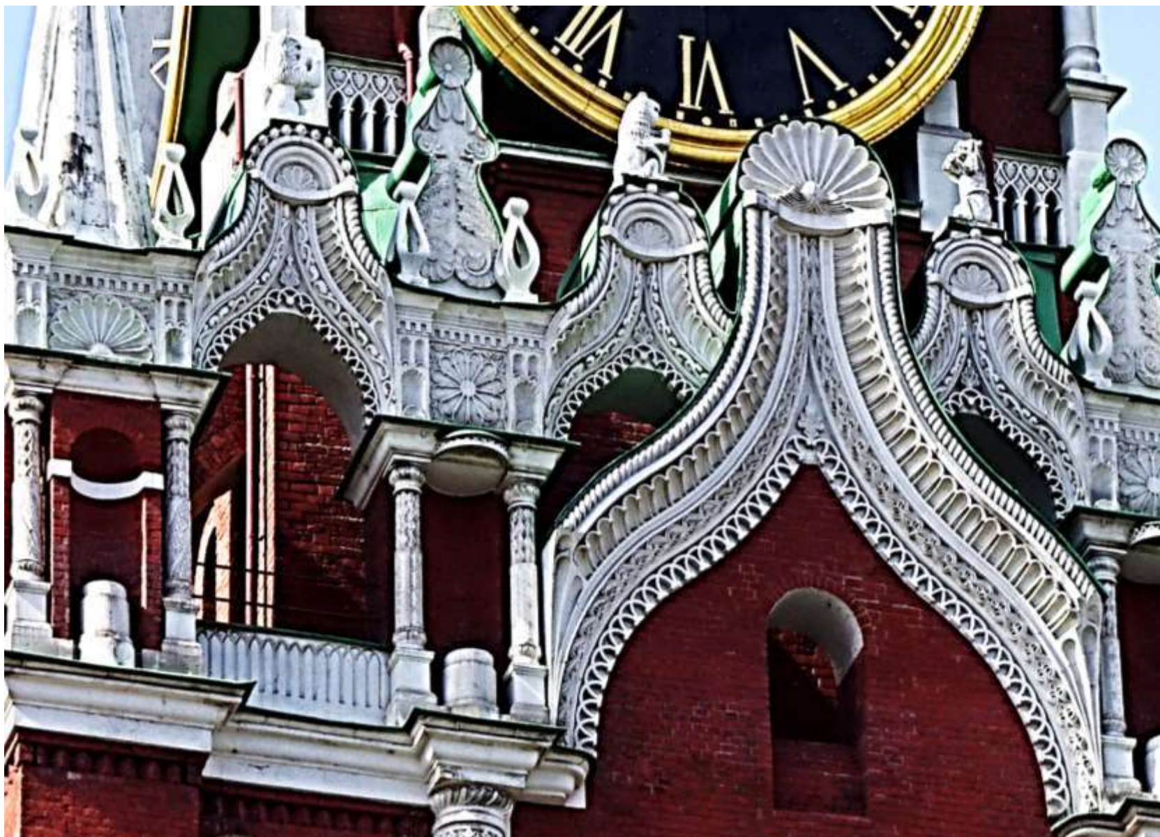
Рис. 3. Фрагменты декора фасада Спасской башни