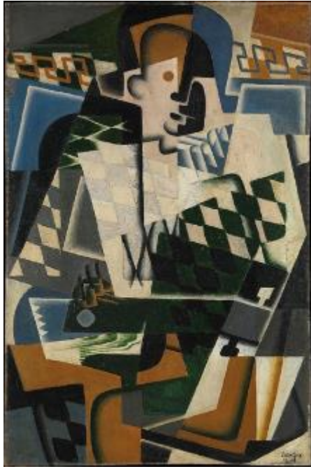
Х. Грис. Арлекин с гитарой. 1917