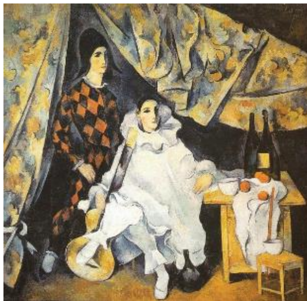
А.В. Шевченко. Пьеро и Арлекин. Братья-жонглёры Сирано. 1920