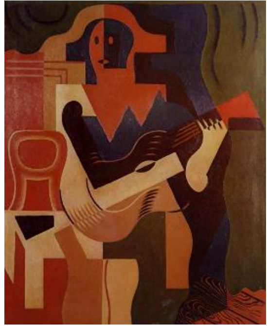
Х. Грис. Арлекин с гитарой. 1919