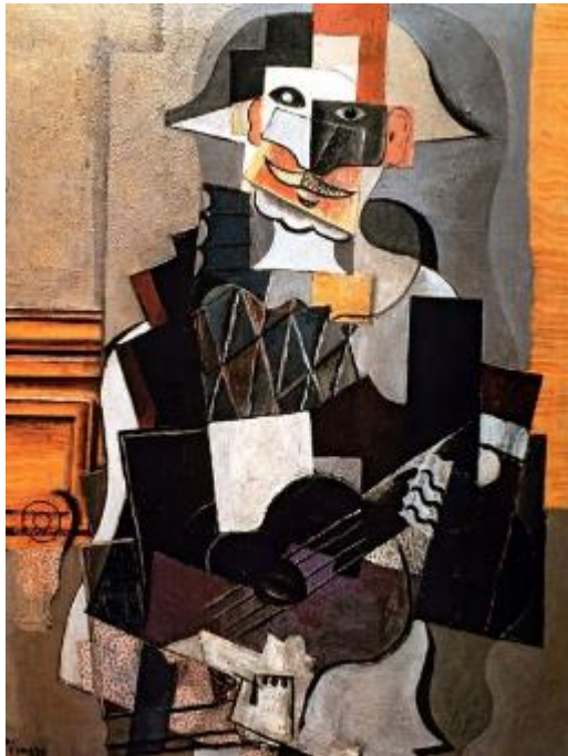
П. Пикассо. Арлекин, играющий на гитаре. 1918

Посмотрите на изображения Арлекина, собранные в задании. Их авторами были Пабло Пикассо и Хуан Грис – создатели кубизма как направления. Эти восемь произведений написаны ими в короткий срок – за четыре года, с 1915 по 1919 гг. Подумайте, что, несмотря на фундаментальное сходство, отличает изображения Арлекина Пикассо от Арлекина Гриса? Какие формальные, пластические, цветовые и образные задачи предпочитает решать каждый из мастеров, обращаясь к этому образу? Для ответа на вопрос напишите небольшое рассуждение объёмом 8–10 предложений.