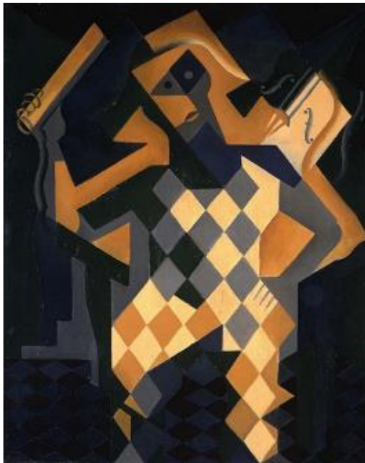
Х. Грис. Арлекин со скрипкой. 1919