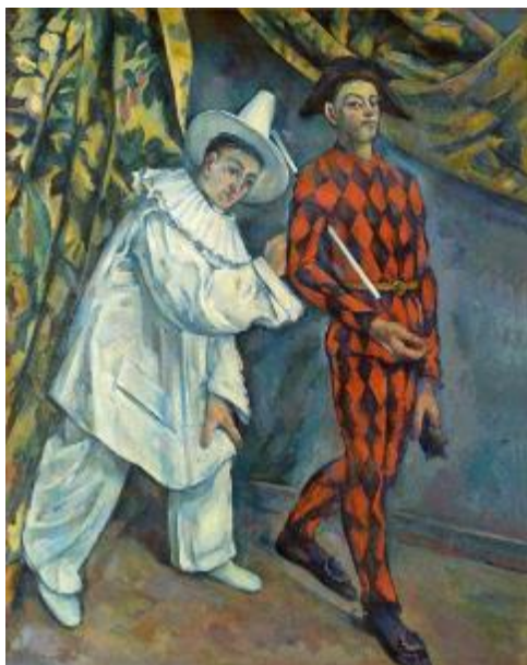
П. Сезанн. Пьеро и Арлекин. 1888–1890

Попытайтесь обобщить свои наблюдения и сформулировать вывод о том, каков вектор изменений, которые вносит в своё решение каждый из живописцев, в сравнении с первоисточником.