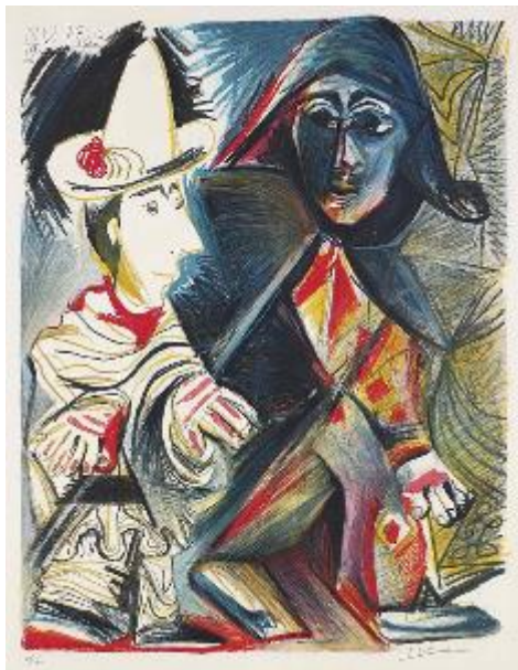
П. Пикассо. Клоун и Арлекин. 1971