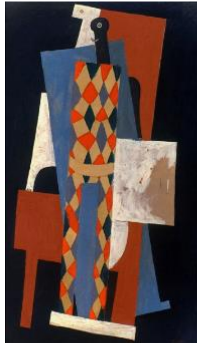
П. Пикассо. Арлекин. 1915