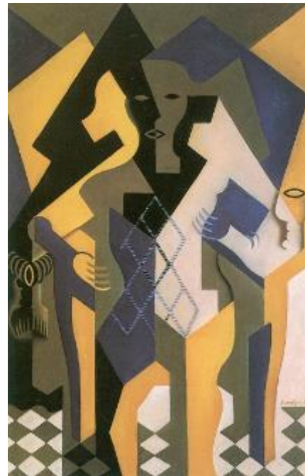
Х. Грис. Арлекин у стола. 1919