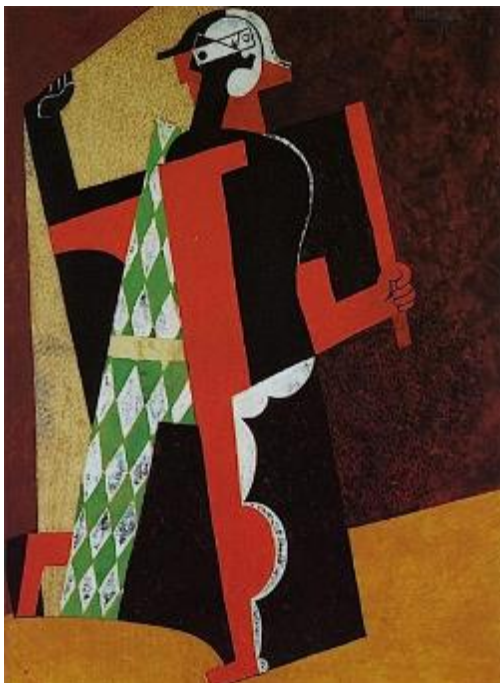
П. Пикассо. Арлекин. 1917