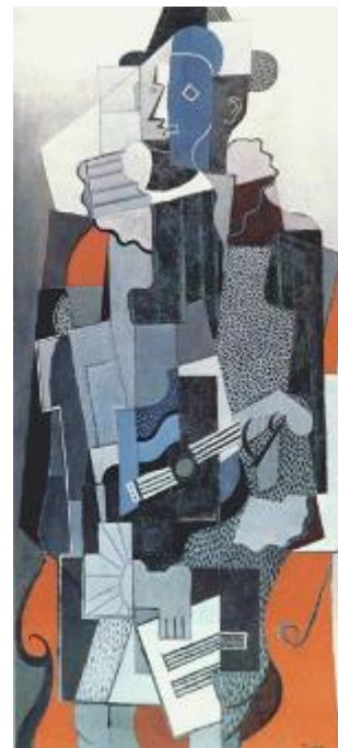
П. Пикассо. Арлекин. 1918