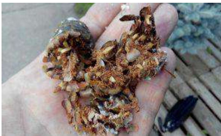
Шишка, повреждённая шишковой огнёвкой

Шишковая огнёвка повреждает шишки разных хвойных пород деревьев и их молодые побеги. После рождения гусеницы вгрызаются в шишки и развиваются там. Часто их можно встретить внутри молодых побегов елей и сосен, где они протачивают ходы. К каким последствиям может привести вспышка численности шишковой огнёвки на данном участке елового леса?