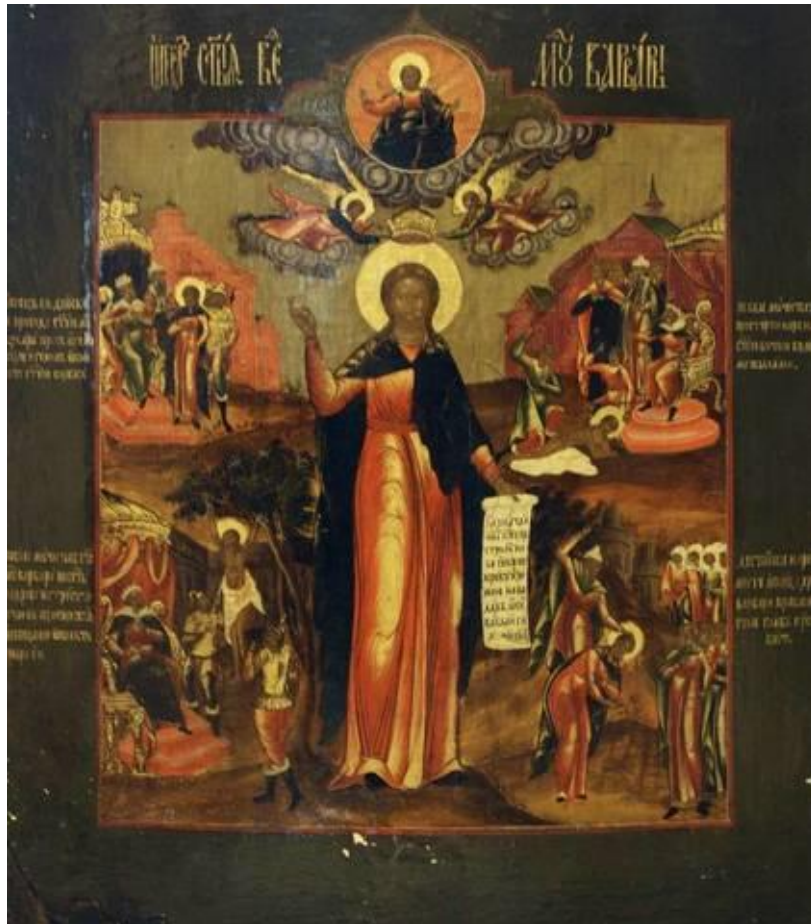
Великомученица Варвара. Палехская икона второй половины XVIII века

В задании вам в качестве примера представлена палехская икона «Святая Варвара» XVIII века и подобраны четыре миниатюры к «Сказке о царе Салтане», созданные художниками Палеха в разные годы советской эпохи. Внимательно рассмотрите иллюстрации и прочитайте утверждения, в которых раскрываются разные аспекты того, как палехские мастера используют иконописные приёмы в миниатюрах на сказочную тему.