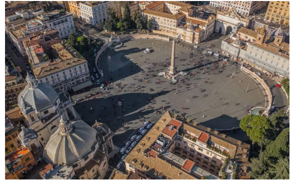
Г. Площадь дель Пополо

Рассмотрите живописные и графические изображения.