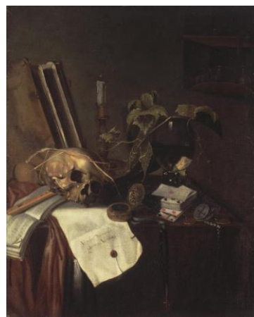
6 Стенвейк, Питер ван (ок. 1615–1654). Натюрморт с черепом XVII в.