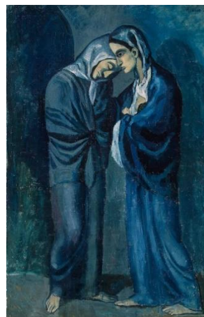
12 Пабло Пикассо. Две сестры. 1902