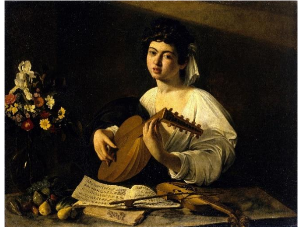
8 Караваджо. Юноша с лютней. 1596