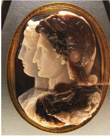
7 Камея Гонзага. III в. до н. э