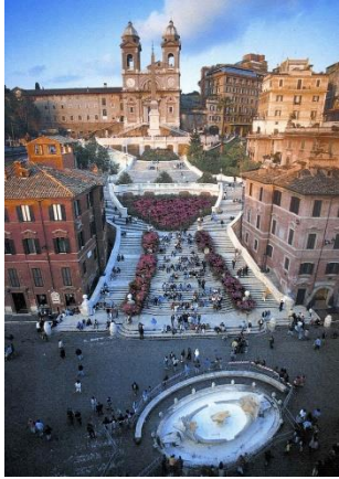
В. Площадь Испании