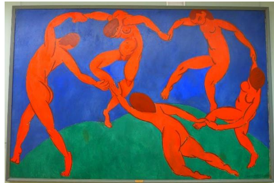
4 Анри Матисс. Танец. 1910