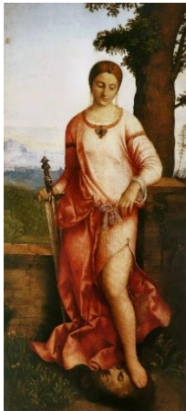
5 Джорджоне. Юдифь. 1504