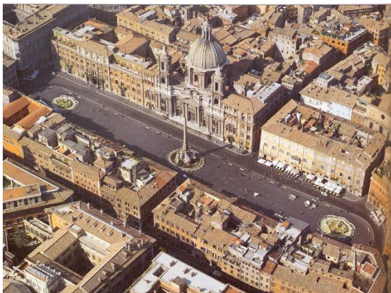
А. Площадь Навона

Посмотрите на аэрофотосъёмку четырёх площадей Рима, собранных в задании: площади Навона, Капитолийской площади, площади Испании и площади дель Пополо.