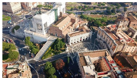
Б. Капитолийская площадь