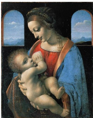
11 Леонардо да Винчи. Мадонна Литга. 1490-е