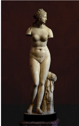
3 Венера Таврическая. II в. до н. э