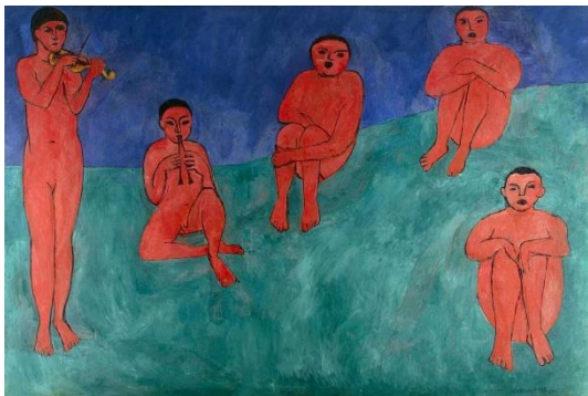
9 Анри Матисс. Музыка. 1910