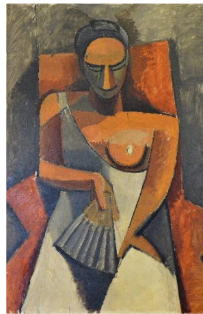
10 Пабло Пикассо. Дама с веером. 1909